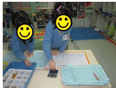
透過親子工作紙，統計幼兒經常乘搭的交通工具 - 港鐵。