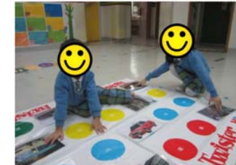
扭扭樂-交通工具與乘搭地方