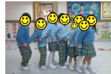
用肢體扮演交通工具