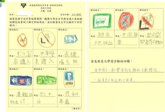
透過親子活動，幼兒發現很多與交通相關的符號及標誌。