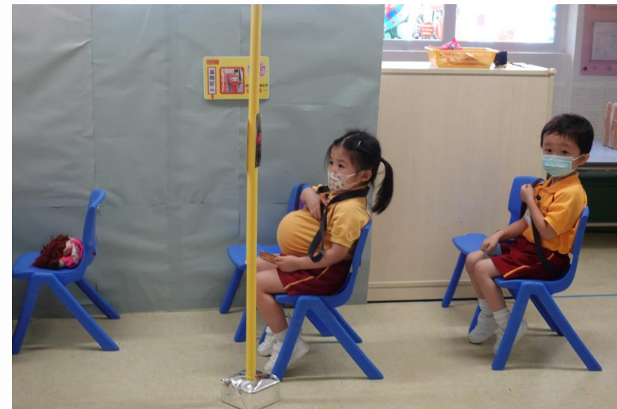
乘搭巴士要扣好安全帶來!