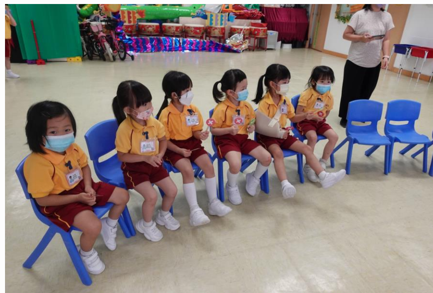
看看他們的行為是否正確