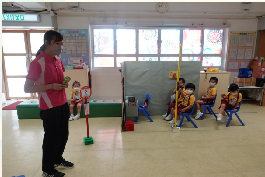
一起玩大電視遊戲