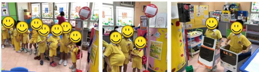
排隊等巴士到大肌肉室做運動