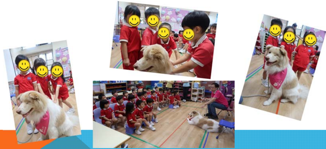
邀請動物大使到校