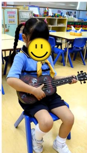
我的興趣是彈小結他