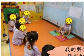
我的興趣是彈彩虹鐘