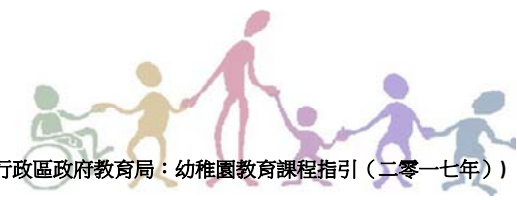
(香港特別行政區政府教育局：幼稚園教育課程指引(二零一七年))